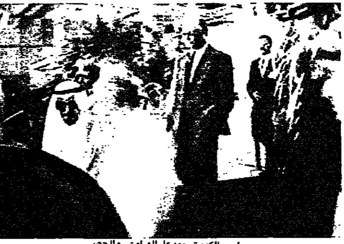
امير الكويت مودعا الهراوي والحص

ما رايك بمقررات قمة بغداد وانشاء صندوق لدعم لبنان؟ ك: كما تعلمي ان تكون المقررات التي تتعلق بلبنان على مستوى الاحداث الاخيرة وللصيربة التي يمر بها لبنان، ان قر العرب، وهم مشكورون، دعم لبنان لإنشاء صندوق عربي، دولي، ولكن ليسمع في العرب ان خمس بهاتين الكلمتين: ان قمة فلسطين، قررت مساعدة لبنان بمبلغ مليار دولار، ويتبقى لنا نحن في ذمّة العرب من مؤتمر فلسطين و٦٠٠ مليون دولار، مع احتراماً وتقديراً لشعورهم وعاطفتهم لراة انشاء هذا الصندوق، عليهم ان يسدّدوا للبنان، او جزء من الدين على العالم العربي، هذه هي ملاحظاتي حول قمة بغداد وانعكاسها على لبنان، فلفروض ان تكون انعكاساتها ايجابية على الصعيد الاقتصادي، ولو انهم بدأوا بدفع ديونهم لكانوا قد انتهوا منها الان، ولكن الدولار حبط على الاقل فهذا القرار كغيره من القرارات، التي اتخذت منذ ١٥ سنة وحتى الان، فهي مجرد كلام.